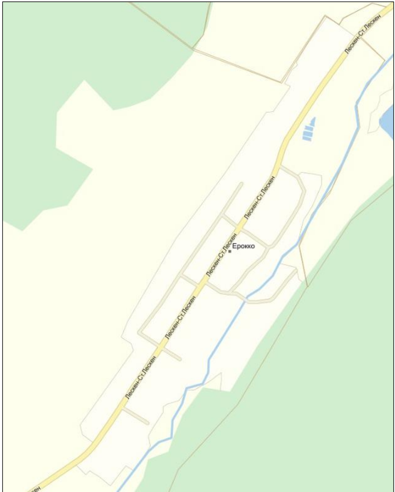
Схема расположения Сельского поселения Ерокко